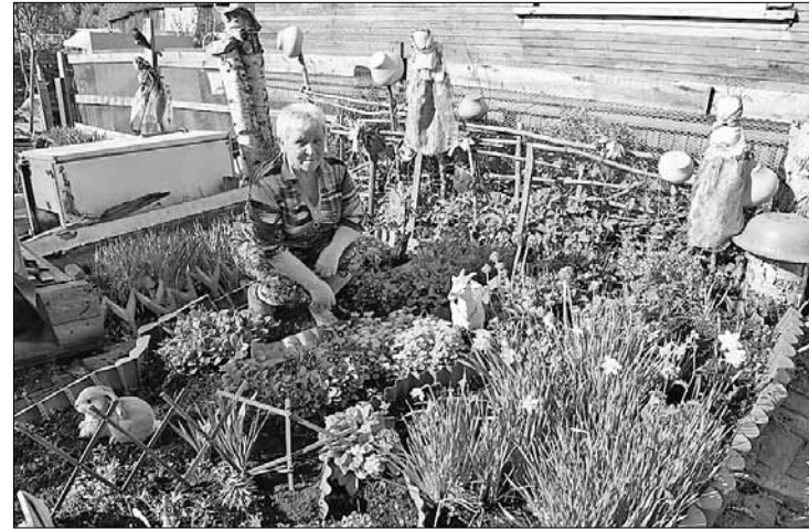
■ Двор на ул. Заводской, 102